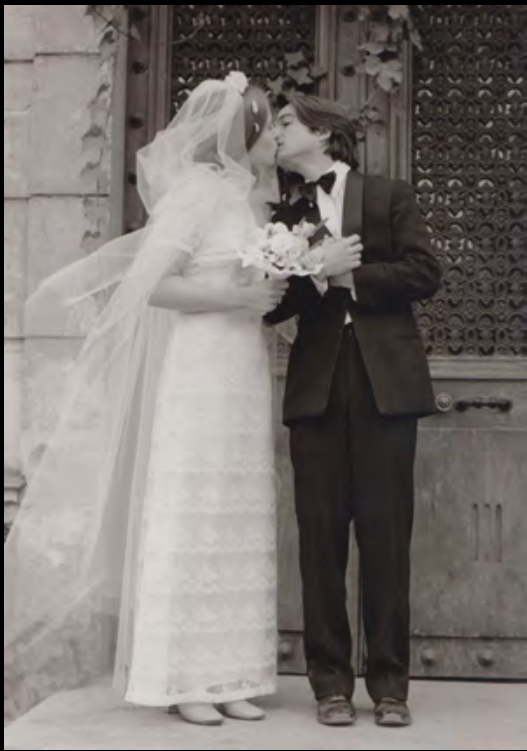
20. [Cinema/Truffaut]. ZUCCA (Pierre) Domicile Conjugal . Jean Pierre Léaud, Claude Jade. Ensemble de deux tirages originaux. 1970. Dimensions : 13 x 18,7 cm pour chaque photographie. Tampon humide au dos. 150 €