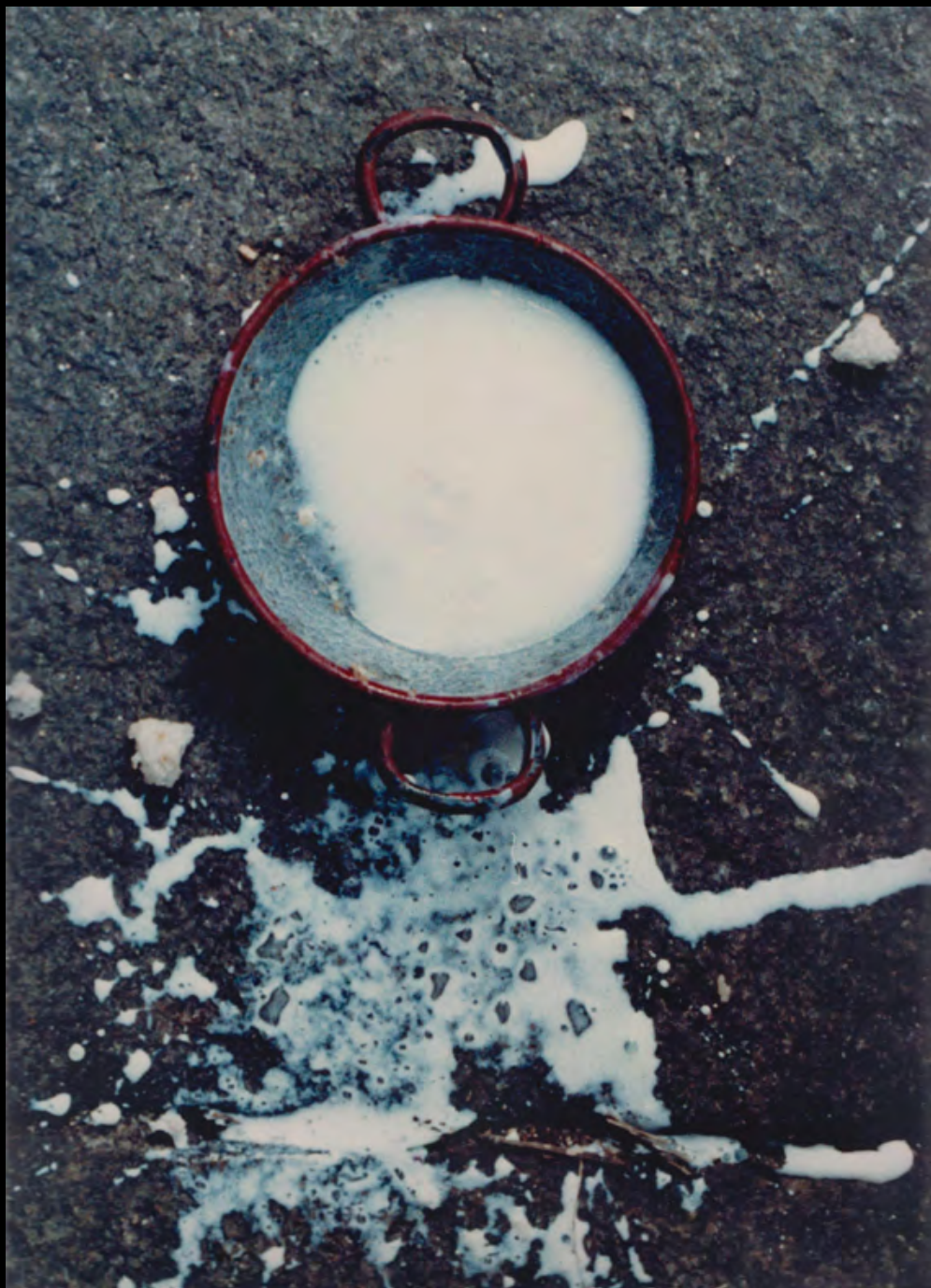
27. GLAESER (Henri) Assiette de lait . Tirage original en couleurs. Dimensions : 36 x 24,2 cm. Au dos à la mine de plomb : « H. G ».