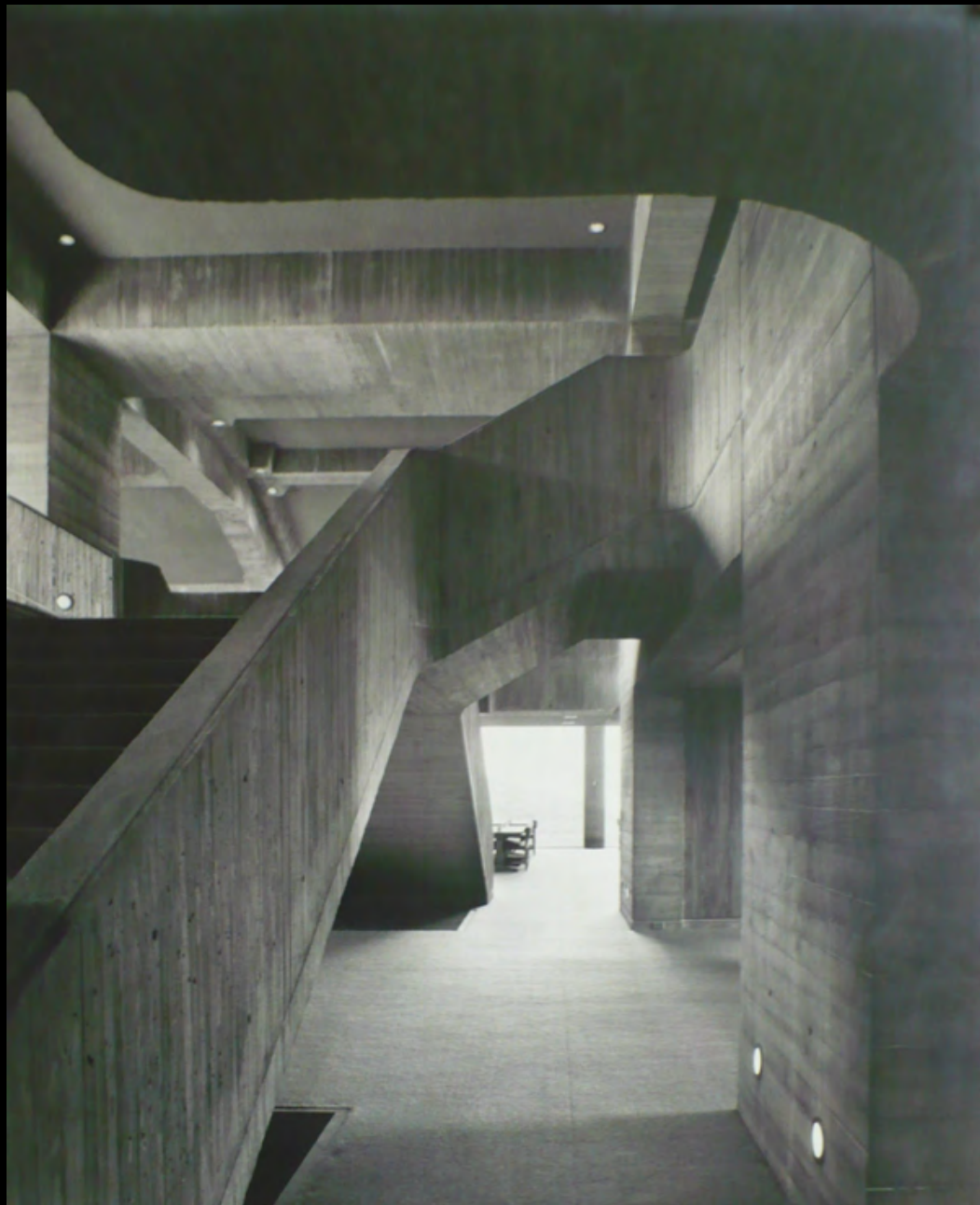
4. [Architecture] WILLIAM (Lawrence. S.) Tirage argentique, contrecollé sur carton. ca. 1965. Dimensions : 50,5 x 40,5 cm. Tampon humide au dos : « Lawrence S. Williams, Inc. Photography, 9101 west chester pike, upper darby, PA.1902 ».