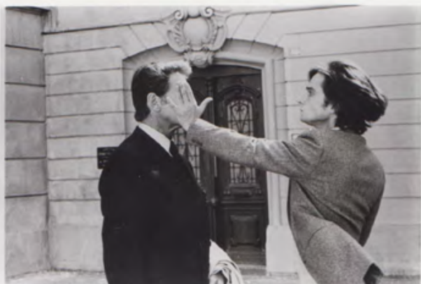
23. [Cinema/Truffaut]. ZUCCA (Pierre) La Nuit Américaine . Jean Pierre Léaud et Jean-Pierre Aumont. Séquence. Tirage original. 1972. Dimensions : 19 x 24,5 cm. Au dos tampon humide. 130 €