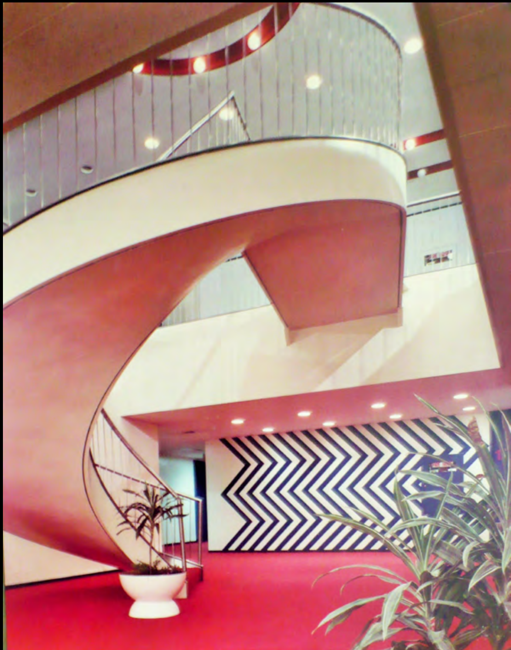
3. [Architecture] WILLIAM (Lawrence. S.) Tirage original en couleurs, contrecollé sur carton. ca. 1965. Dimensions : 51 x 40,5 cm. Tampon humide au dos : « Lawrence S. Williams, Inc. Photography, 9101 west chester pike, upper darby, PA.1902 ». 80 €