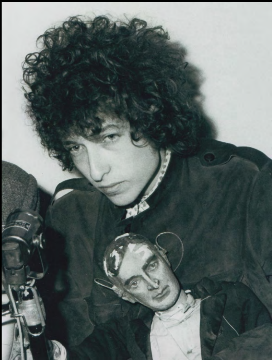
45. [Rock]. RANCUREL (Jean-Louis) Bob Dylan à l'Hôtel Georges V en 1966 Tirage argentique postérieur de 1980 réalisé par le photographe. Dimensions : 24 x 20 cm. Signé et légendé au dos. 150 €