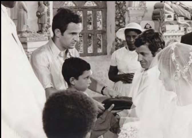
15. [Cinema/Truffaut]. RAEMY (Léonard de) La Sirène du Mississipi. La cérémonie. François Truffaut, Jean-Paul Belmondo et Catherine Deneuve. Ensemble de trois tirages argentiques. 1969. Dimensions : une photo de 11,4 x 17,9 cm et deux de 13 x 18 cm. Au dos tampon humide pour deux exem- plaires. 150 €