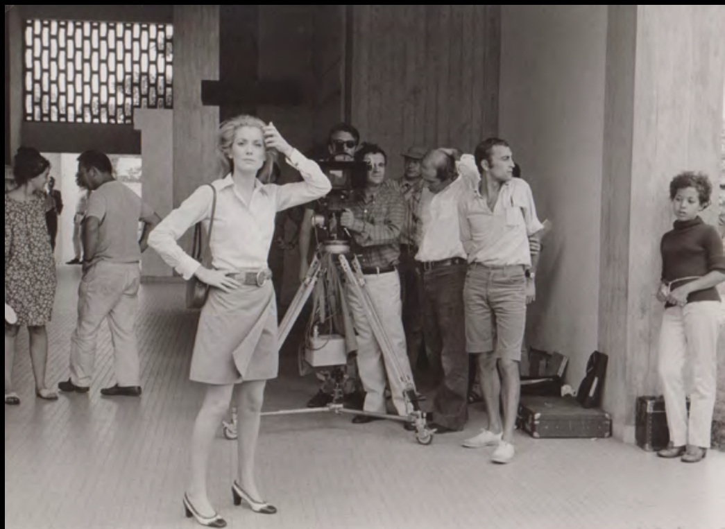
13. [Cinema/Truffaut]. RAEMY (Léonard de) La Sirène du Mississippi . François Truffaut et Catherine Deneuve. Tirage argentique. 1969. Dimensions : 13 x 18,3 cm. Au dos tampon humide. 120 €