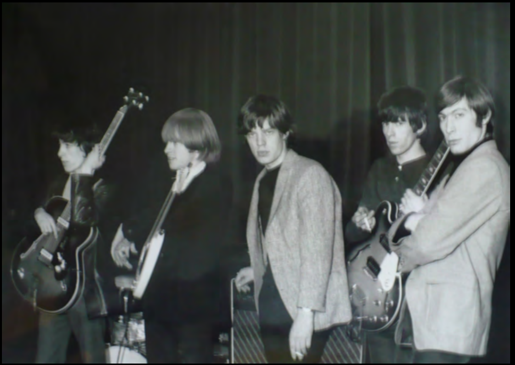
44. [Rock] LAMPARD (Bob) Les Rolling Stones à l'Olympia en 1964 . Tirage argentique postérieur de 1980 réalisé par le photographe. Dimensions : 30,4 x 40,5 cm. Signé et légendé au dos. 350 €