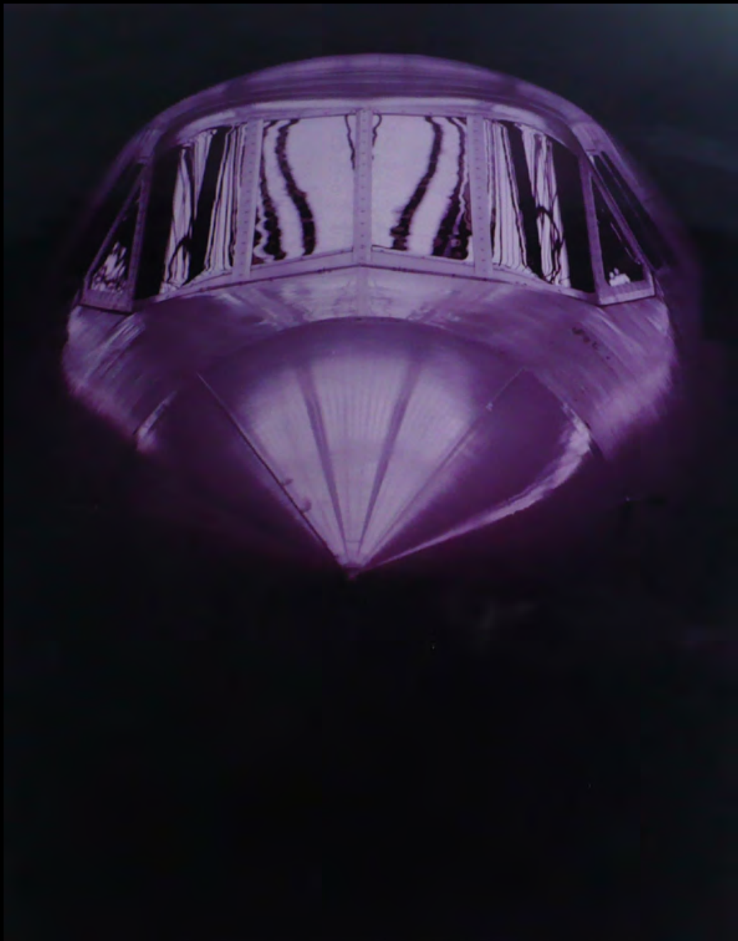
5. [Aviation]. GESTERMAUN Le Concorde . Tirage original en couleurs. ca. 1975. Dimensions : 40,5 x 30,5 cm. Sur carton, signé sur le passe partout, au dos étiquette : « 1ère expo Concorde, Gestermaun photographe ». dans son cadre d'origine. 400 €