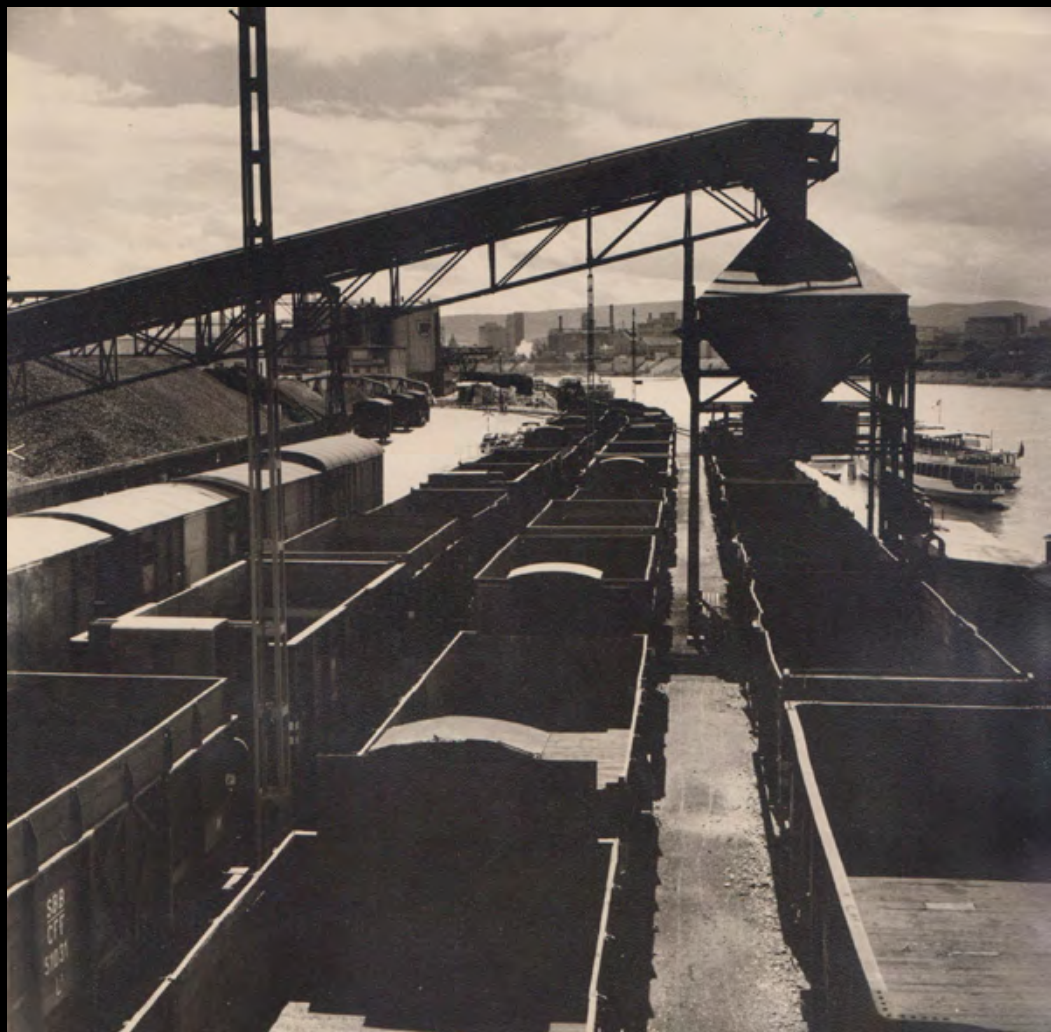
39. [Paris]. GLAESER (Henri) Rive gauche . Tirage original. Dimensions : 18 x 24 cm. Au dos tampon humide : « Photo Henri Glaeser ».