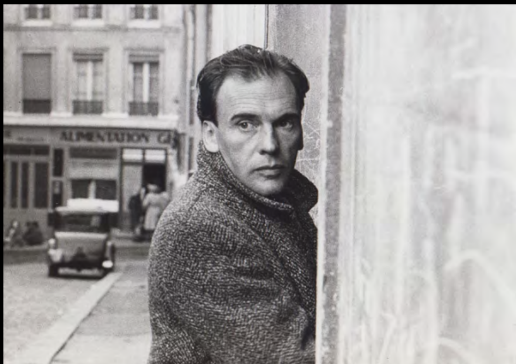
10. [Cinéma] RODRIGUE (Victor) FLIC STORY . Jean-Louis Trintignant. Tirage original. 1975. Dimensions : 12,7 x 18 cm. Au dos tampon humide : « Photo Rodrigue ».