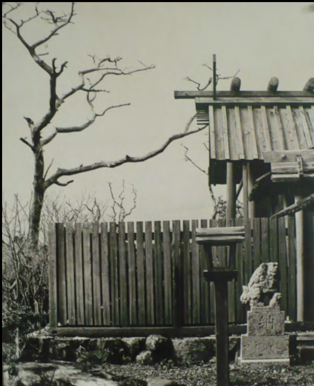
32. [Japon]. ANONYME. Toits et palissades . Tirage original sur papier baryté, contre-collé sur carton. ca.1970. Dimensions : 34,5 x 42,8 cm. 50 €