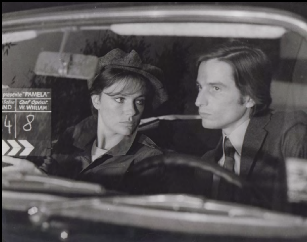
22. [Cinéma/Truffaut]. ZUCCA (Pierre) La Nuit Américaine . Jean Pierre Léaud et Jacqueline Bisset. Tirage original. 1972. Dimensions : 20 x 25 cm. Au dos tampon humide. 130 €