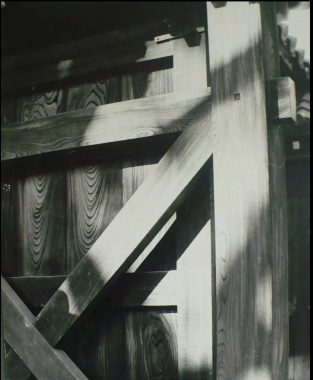
30. [Japon]. ANONYME. Structure . Tirage original sur papier baryté, contrecollé sur carton. ca.1970. Dimensions : 42,5 x 34 cm. 50 €