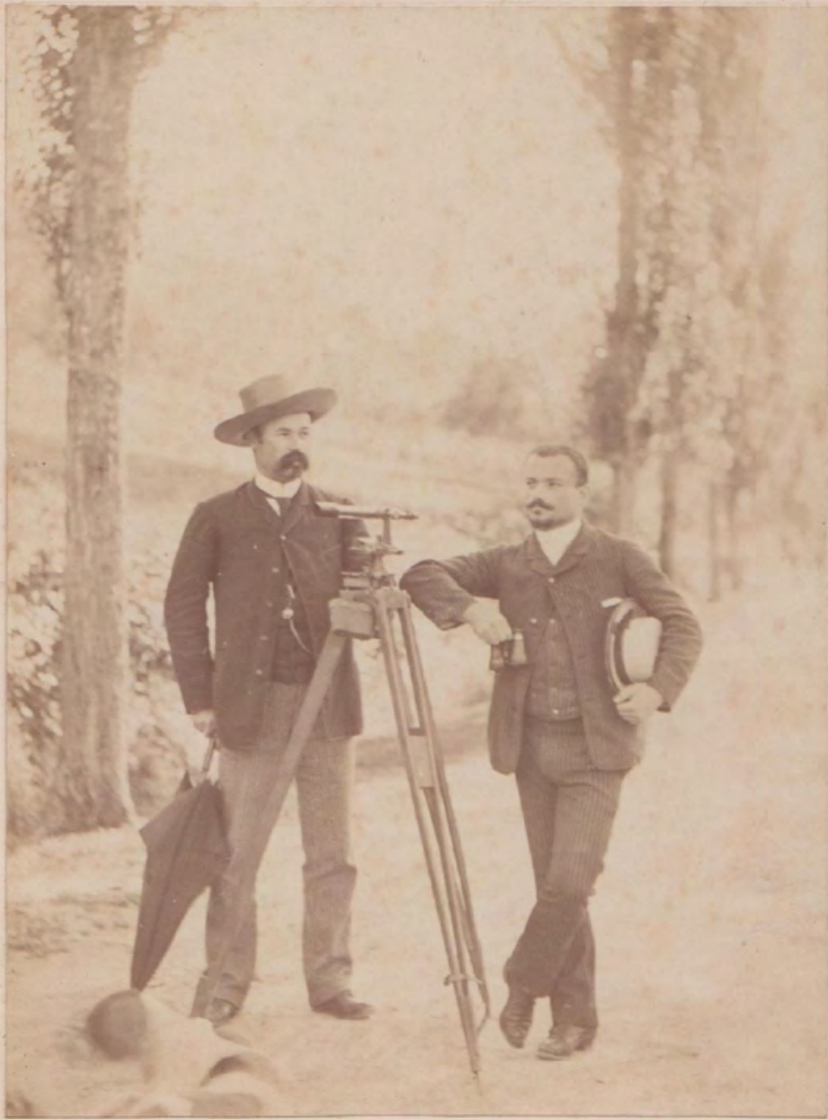
48. [Sciences]. ANONYME. Les Géomètres . Tirage original sur carton. ca.1880. Dimensions hors carton : 14,2 x 10,5 cm avec carton : 22,8 x 17,6 cm. Au dos manuscrit à la mine de plomb : « Construction d'un tunnel vers Toulouse ». 130 €