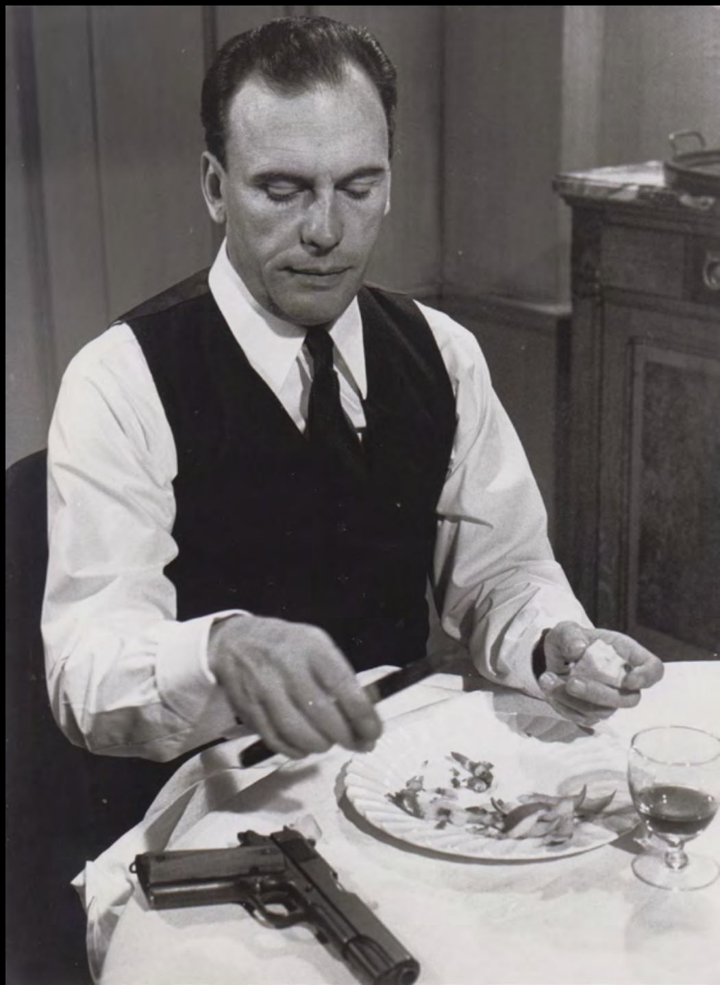
9. [Cinéma] RODRIGUE (Victor) FLIC STORY . Jean-Louis Trintignant. Tirage original. 1975. Dimensions : 24 x 17,6 cm. 60 €