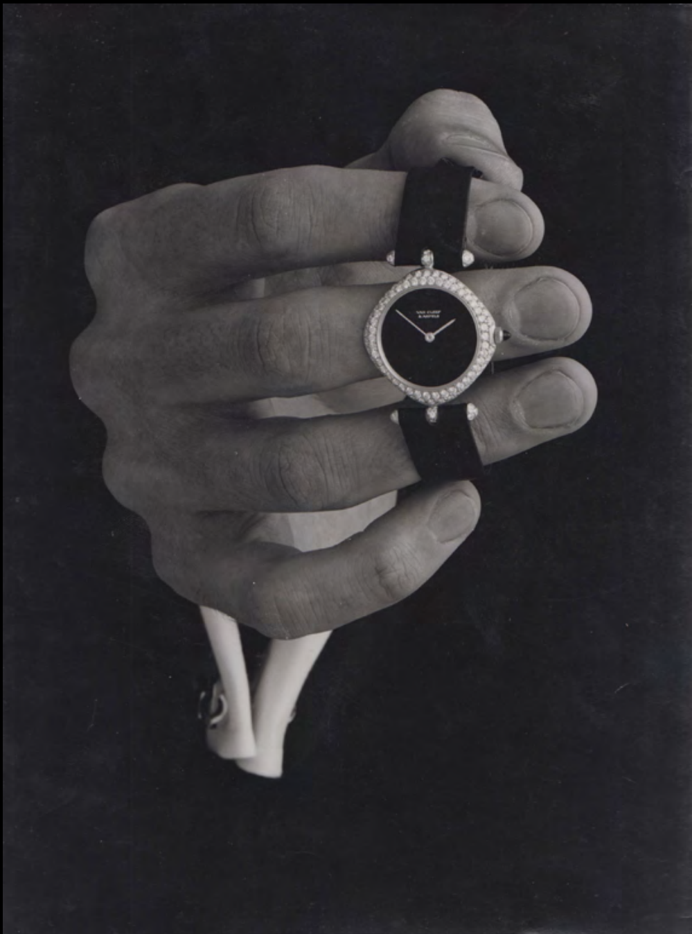
43. [Publicité]. GLAESER (Henri) La main à la montre « Van Cleef and Arpels » . Tirage argentique. ca.1960. Dimensions : 30 x 23,8 cm. Au dos tampon humide : « Photo Henri Glaeser ».