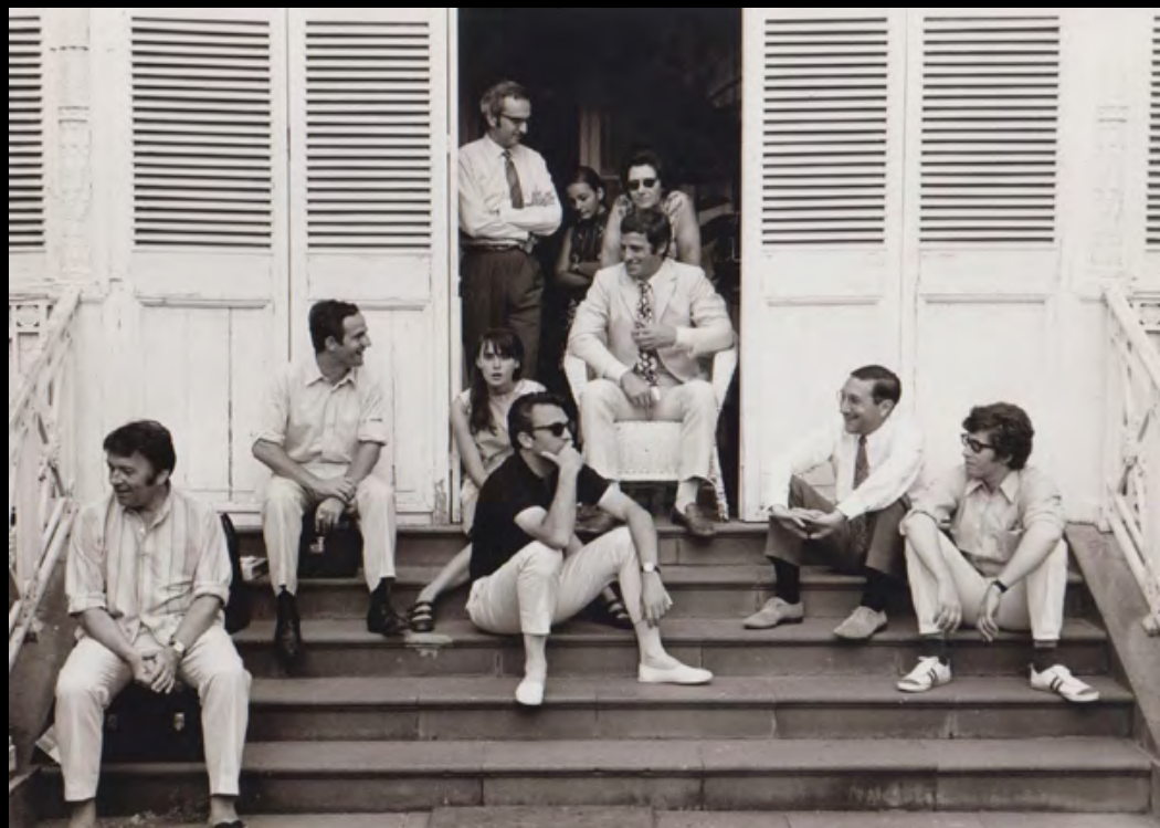
14. [Cinema/Truffaut]. RAEMY (Léonard de) La Sirène du Mississippi . François Truffaut, Jean-Paul Belmondo et une partie de l'équipe. Tirage argentique. 1969. Dimensions : 13 x 18,3 cm. Au dos tampon humide. 120 €