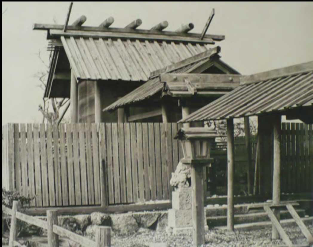
29. [Japon]. ANONYME. Palissade Tirage original sur papier baryté, contrecollé sur carton. ca.1970. Dimensions : 42,5 x 34,7 cm.