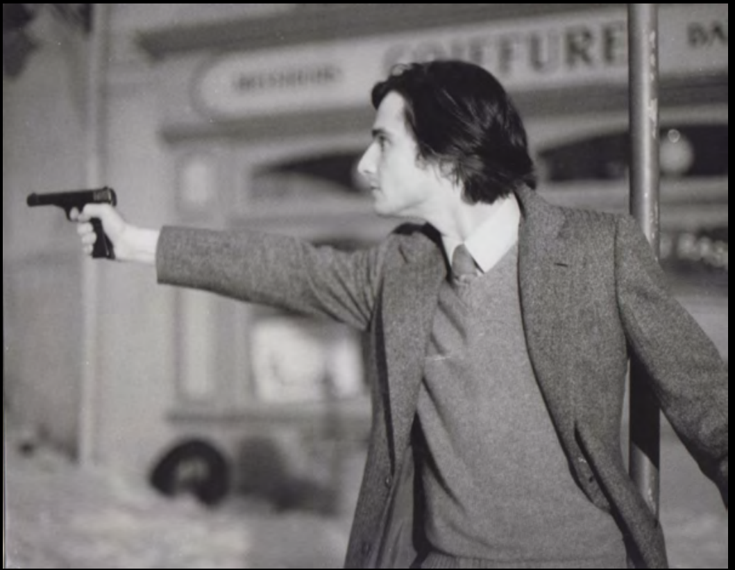
24. [Cinema/Truffaut]. ZUCCA (Pierre) La Nuit Américaine . Jean Pierre Léaud. Tirage original. 1972. Dimensions : 20 x 25 cm. Au dos tampon humide. 130 €