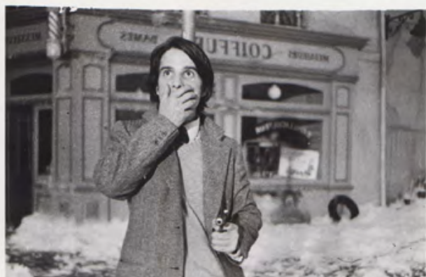
25. [Cinema/Truffaut]. ZUCCA (Pierre) La Nuit Américaine . Jean Pierre Léaud. Séquence. Tirage original. 1972. Dimensions : 19 x 24,8 cm. Au dos tampon humide. 130 €