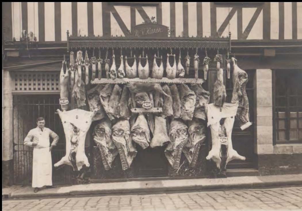
33. [Magasin]. ANONYME. Boucherie . Tirage argentique. ca.1950. Dimensions : 12 x 16,8 cm. Au dos, manuscrit : « Boucherie, 24 rue Arquaise, Fécamp ». 50 €