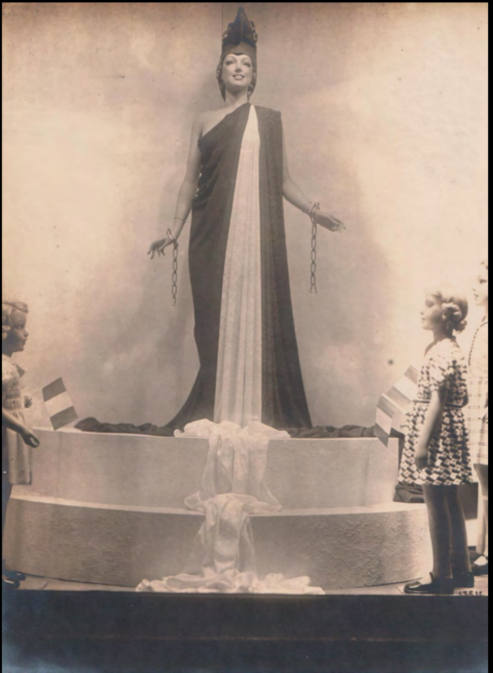
34. [Mannequins]. SINGIER (F.) La République . Tirage argentique. ca.1950. Dimensions : 22 x 16,6 cm. Sous chemise, serpente. 50 €