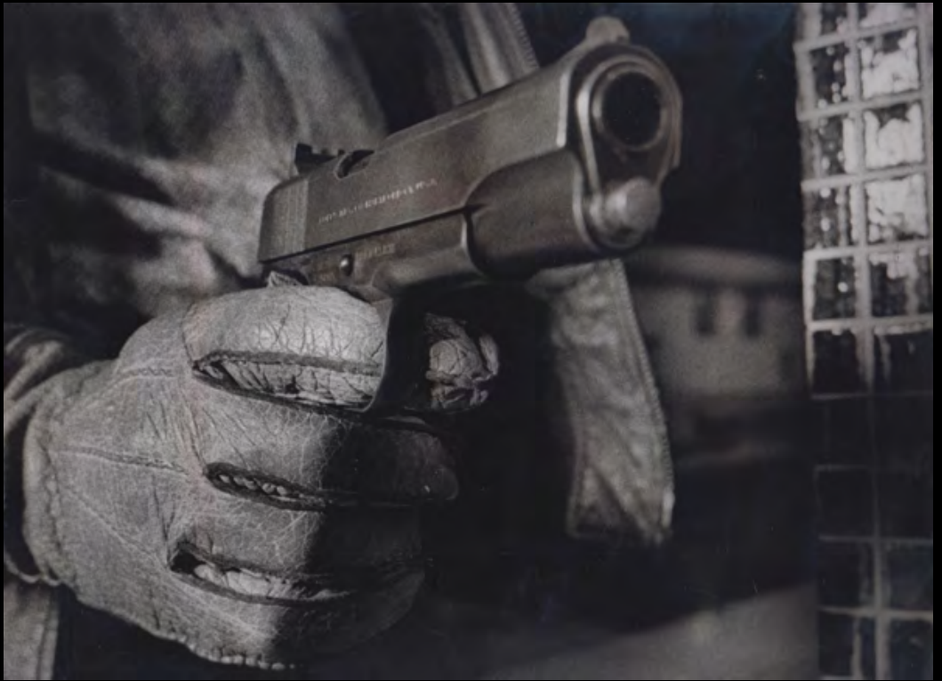
8. [Cinéma] Anonyme. Tropic Tirage argentique. 1971. dimensions : 28,3 x 35,5 cm. au dos inscrit à la mine de plomb : « Tropic 12-12-71 ».