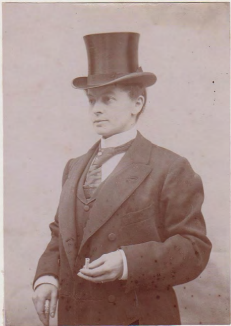
50. [Travestissement]. Anonyme Femme au chapeau et à la cigarette . Tirage original, contre collé sur carton. ca.1890. Dimensions : 8,9 x 6,6 cm. 65 €