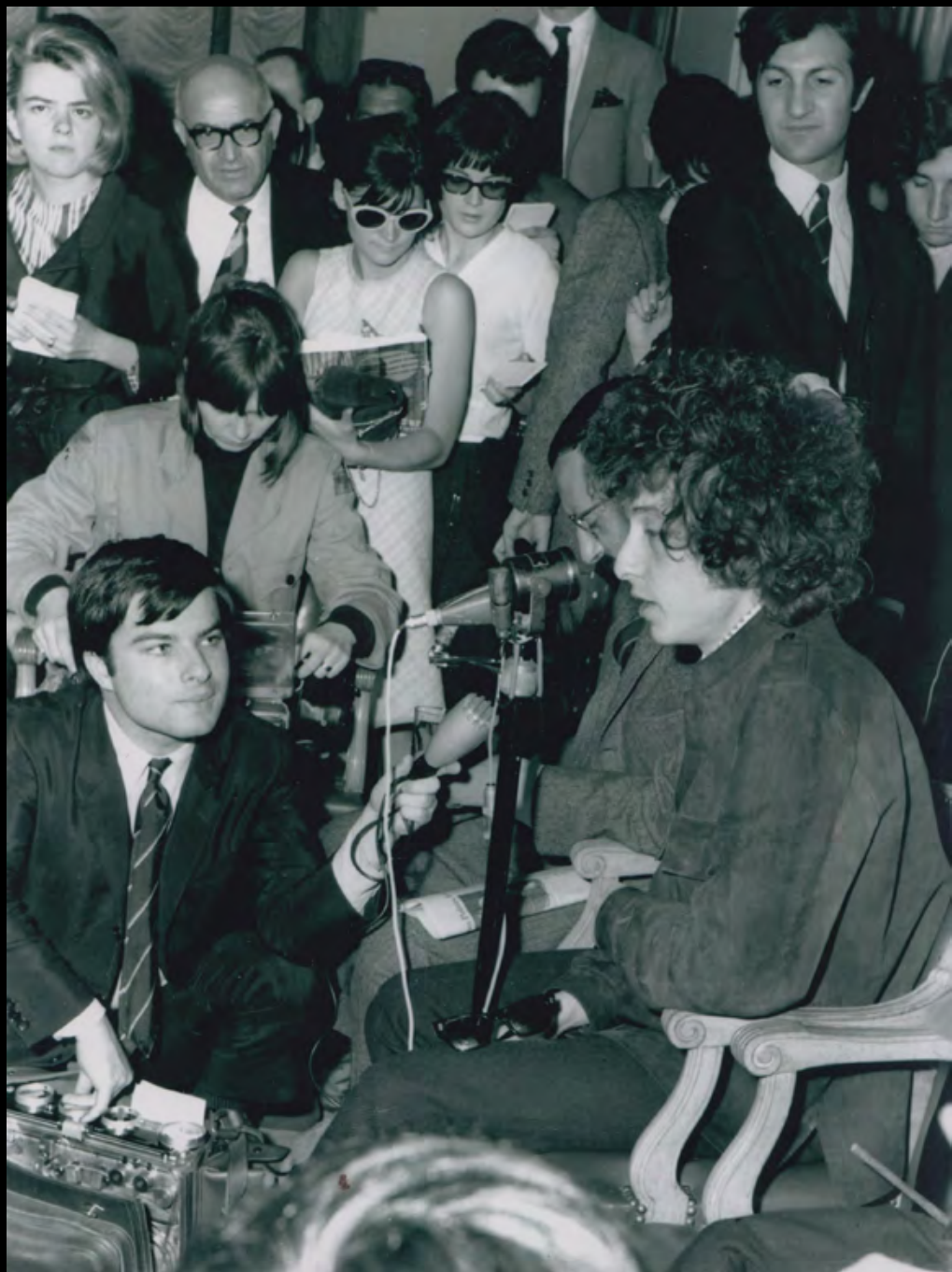
46. [Rock]. RANCUREL (Jean-Louis) Bob Dylan à l'Hôtel Georges V en 1966. Tirage argentique postérieur de 1980 réalisé par le photographe. Dimensions : 24,5 x 18 cm. Signé et légendé au dos. 150 €