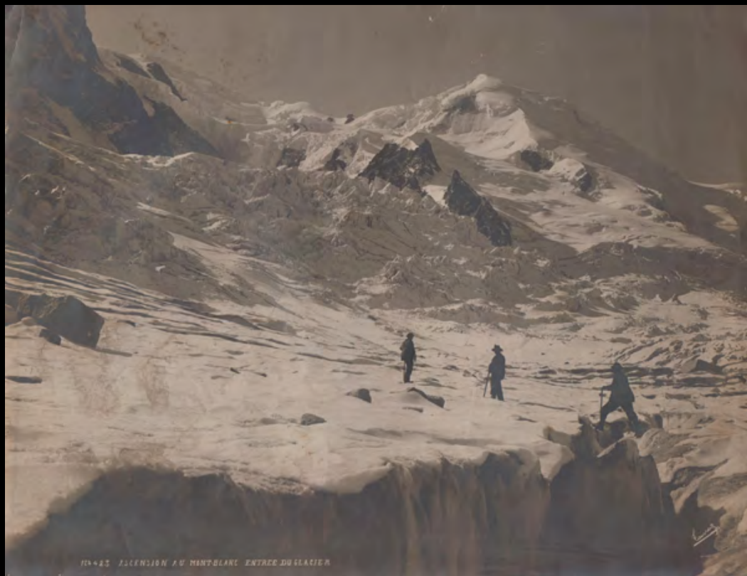
36. [Montagne] TAIRRAZ (Joseph) Ascension au Mont-Blanc. Entrée du glacier. Tirage argentique. ca.1880. Dimensions : 21,9 x 27,8 cm. Taches, un coin cassé. 300 €