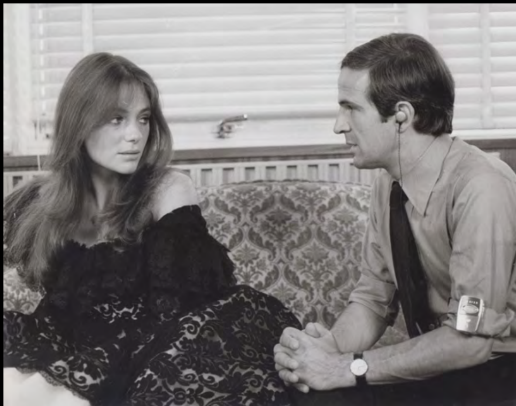
21. [Cinema/Truffaut]. ZUCCA (Pierre) La Nuit Américaine . Jacqueline Bisset et François Truffaut. Tirage original. 1972. Dimensions : 20 x 25 cm. Au dos tampon humide.