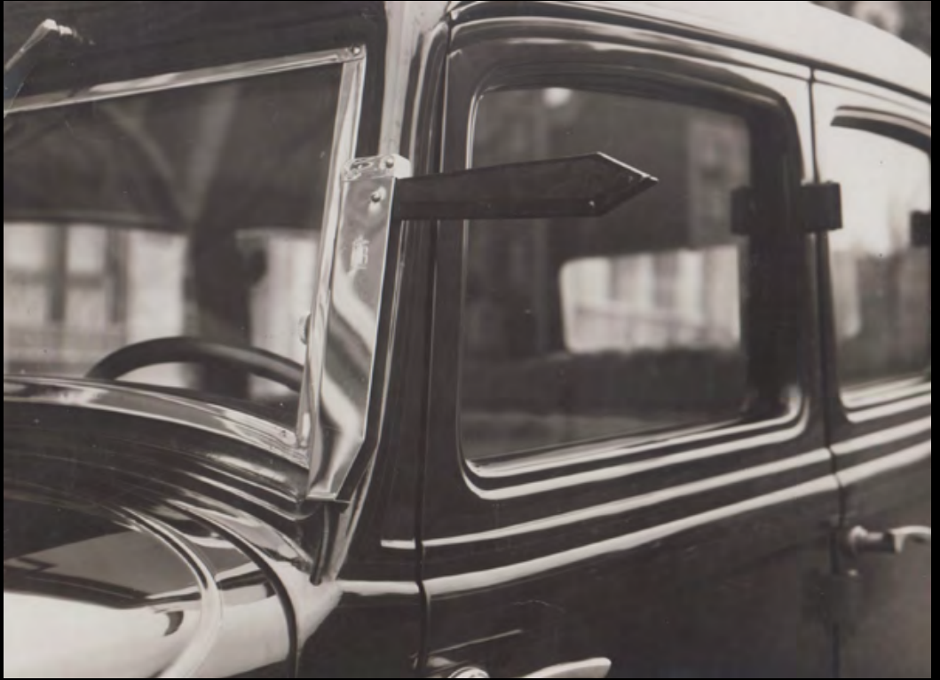
2. ANONYME Voiture et reflets. Tirage Argentique. ca.1930. Dimensions : 17 x 23 cm. 60 €