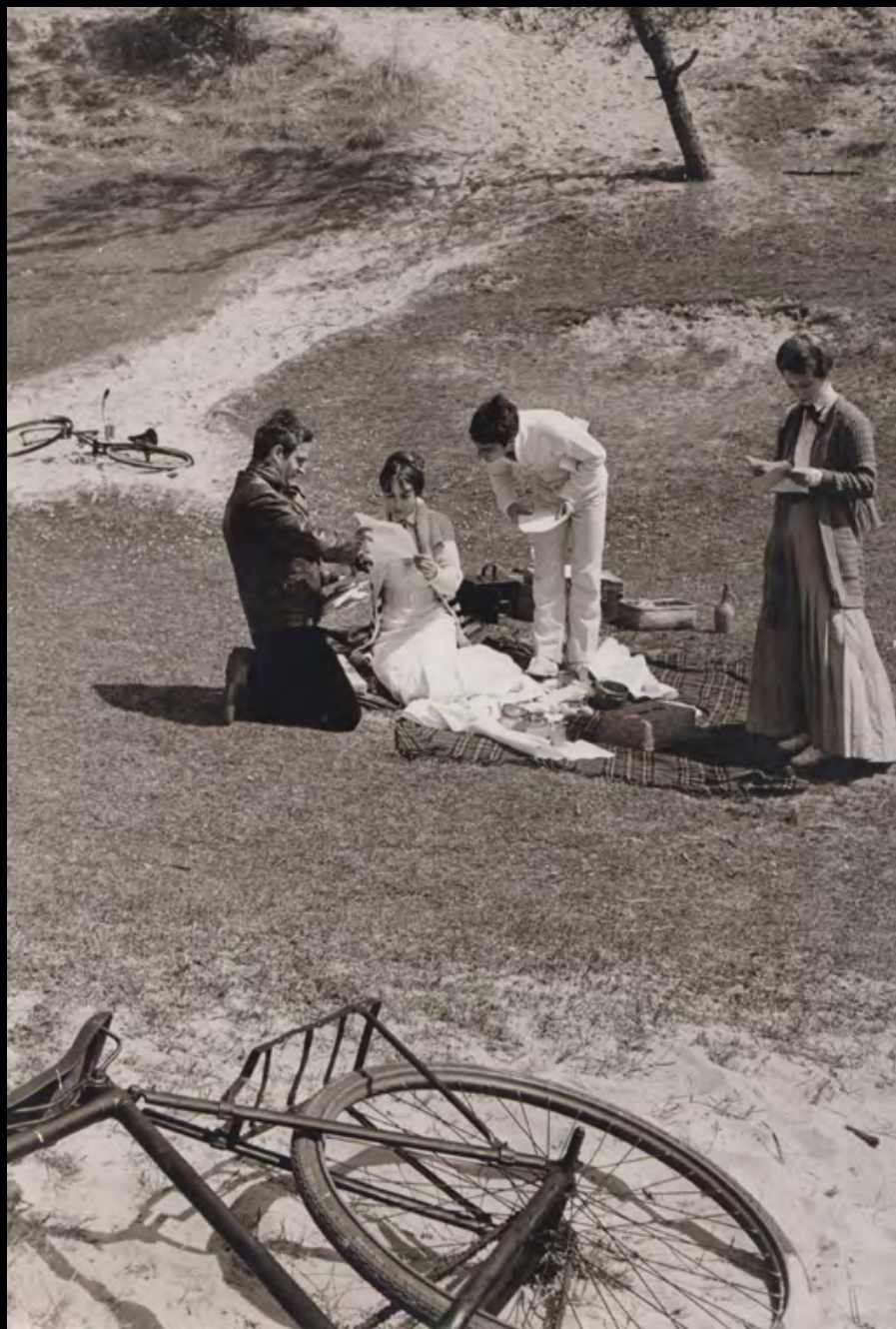
12. [Cinéma/Truffaut]. DEPARDON (Raymond). Les Deux Anglaises et le continent . Tirage argentique. 1971. Dimensions : 29 x 19,4 cm. Tournage du film « Les deux anglaises et le continent » de François Truffaut. Tampon humide au dos : « Photographie par Raymond DEPARDON-GAMMA, 4 rue Auguste Vacquerie – Paris 16 e - 727.12.55 ». 800 €