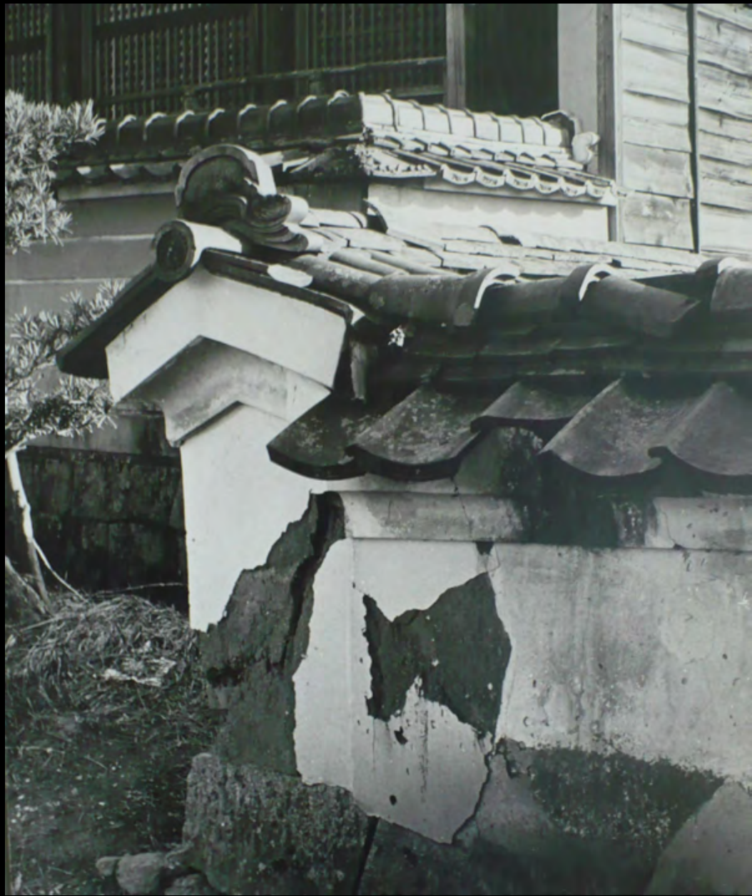
31. [Japon]. ANONYME. Toit . Tirage original sur papier baryté, contrecollé sur carton. ca.1970. Dimensions : 42,5 x 34,5 cm. 50 €