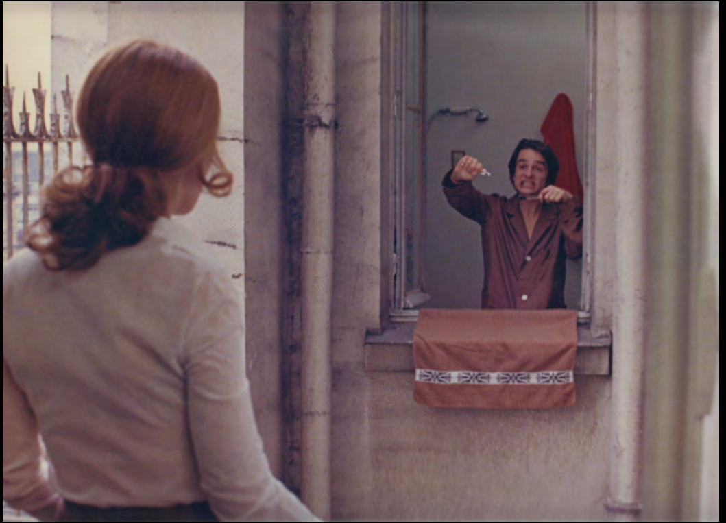
17. [Cinema/Truffaut]. ZUCCA (Pierre) Domicile Conjugal . Jean Pierre Léaud et Claude Jade. Tirage original en couleurs. 1970. Dimensions : 23,5 x 30 cm. 150 €