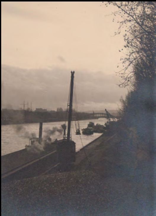
37. [Paris] ANONYME. Vus de chaque extrémité de Paris des bords de seine. Tirage argentique sur papier fort à grains. ca.1930. Dimensions : 22,2 x 16 cm pour chaque photo. 120 €