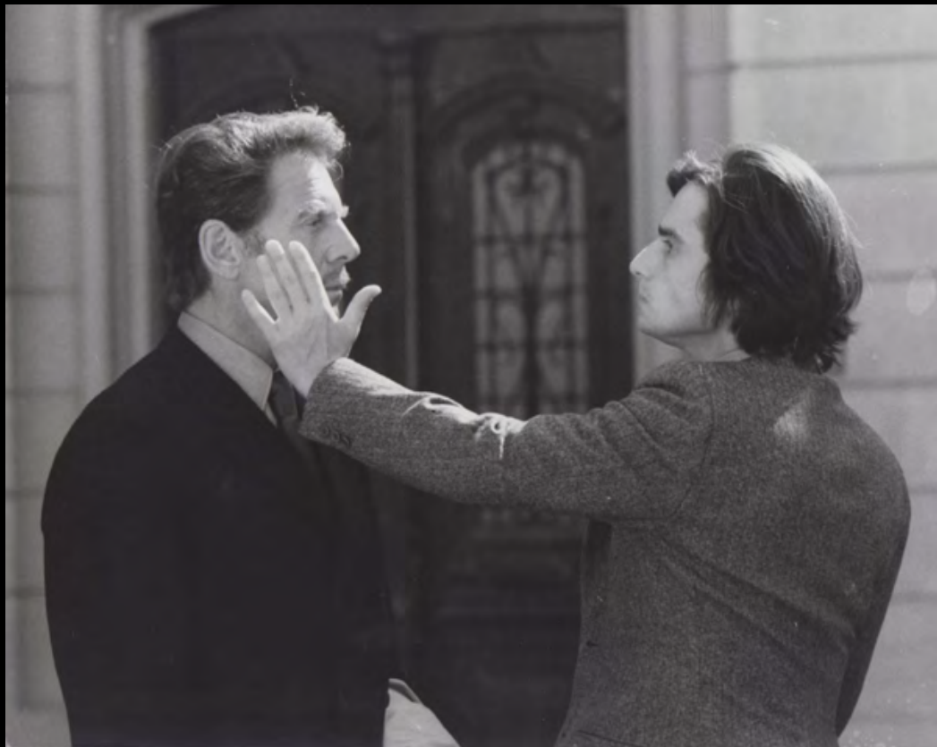
26. [Cinema/Truffaut], ZUCCA (Pierre) La Nuit Américaine . La gifle . Jean Pierre Léaud et Jean-Pierre Aumont. Tirage original. 1972. Dimensions : 19 x 24,5 cm. Au dos tampon humide. 130 €