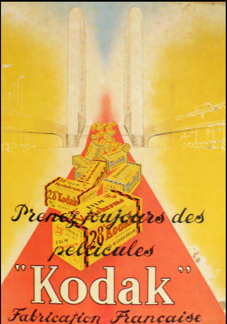
41. [Publicité] KODAK Lithographie en couleurs, collée sur panneau de bois. ca.1937. Dimensions : 50 x 40 cm. Défauts. Très belle image sûrement réalisée pour l'exposition des Arts et Techniques de 1937 à Paris. 80 €