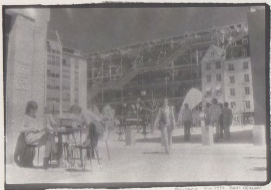
38. [Paris]. GLAESER (Henri) Beaubourg, mai 1977 Tirage original. Dimensions : 17,8 x 24 cm. Photographie signée et datée à la mine de plomb. 50 €