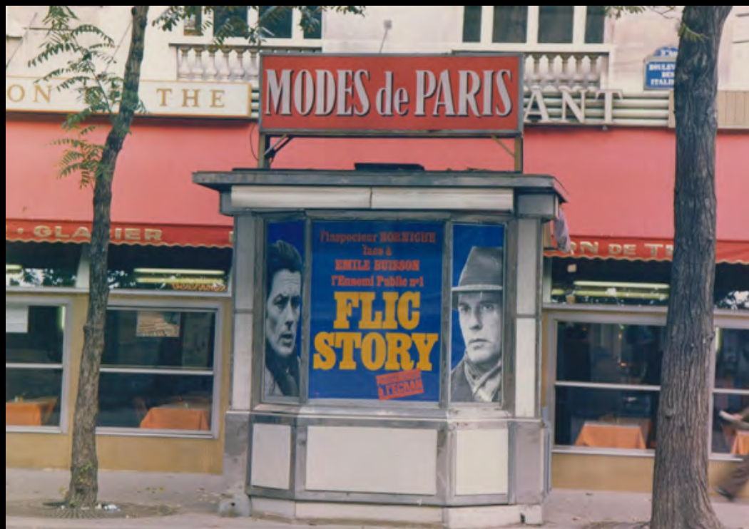
7. [Cinéma] FLIC STORY . Tirage original en couleur. 1975. Dimensions : 12,7 x 17,8 cm. 40 €