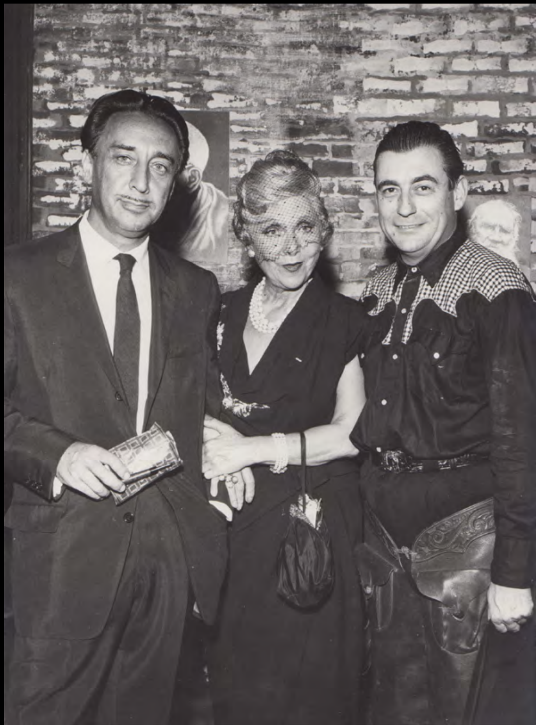
6. [Célébrités] AGENCE BERNAND Romain Gary, Yvonne Printemps et François Perrier . Tirage argentique. ca.1955. Dimensions : 24,4 x 18 cm. Au dos, tampon humide : « Agence de Presse Bernard...106 rue de richelieu...Paris 2 e ». 300 €