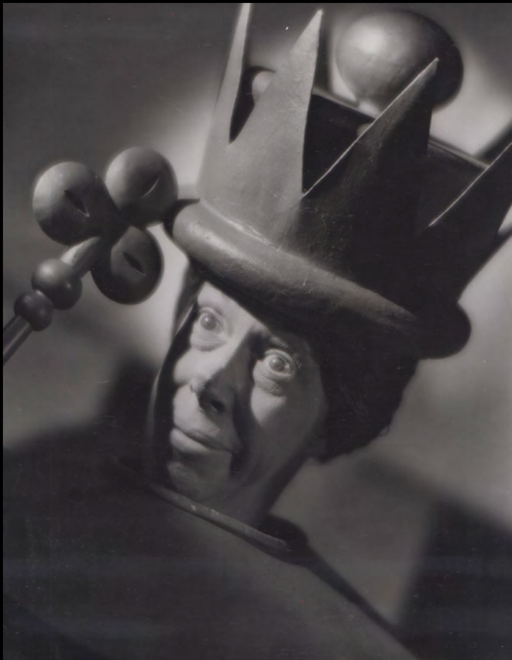
11. [Cinéma] WALLING (William Jr) Edna May Oliver dans « Alice in Wonderland » jouant le personnage de la Reine rouge. Tirage argentique. 1933. Dimensions : 25,7 x 20,4 cm. Au dos tampon humide : « Paramount Photo by Will Walling Jr ». 180 €