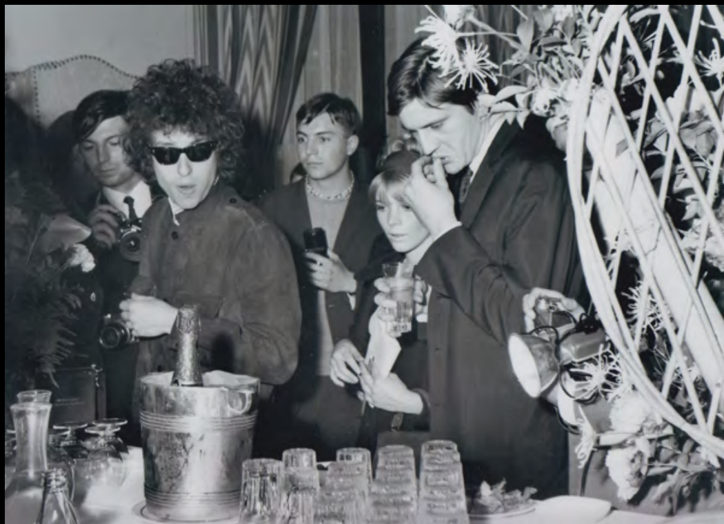
47. [Rock]. RANCUREL (Jean-Louis) Bob Dylan à l'Hôtel Georges V en 1966 . Tirage argentique postérieur de 1980 réalisé par le photographe. Dimensions : 24,5 x 18 cm. Signé et légendé au dos. 150 €