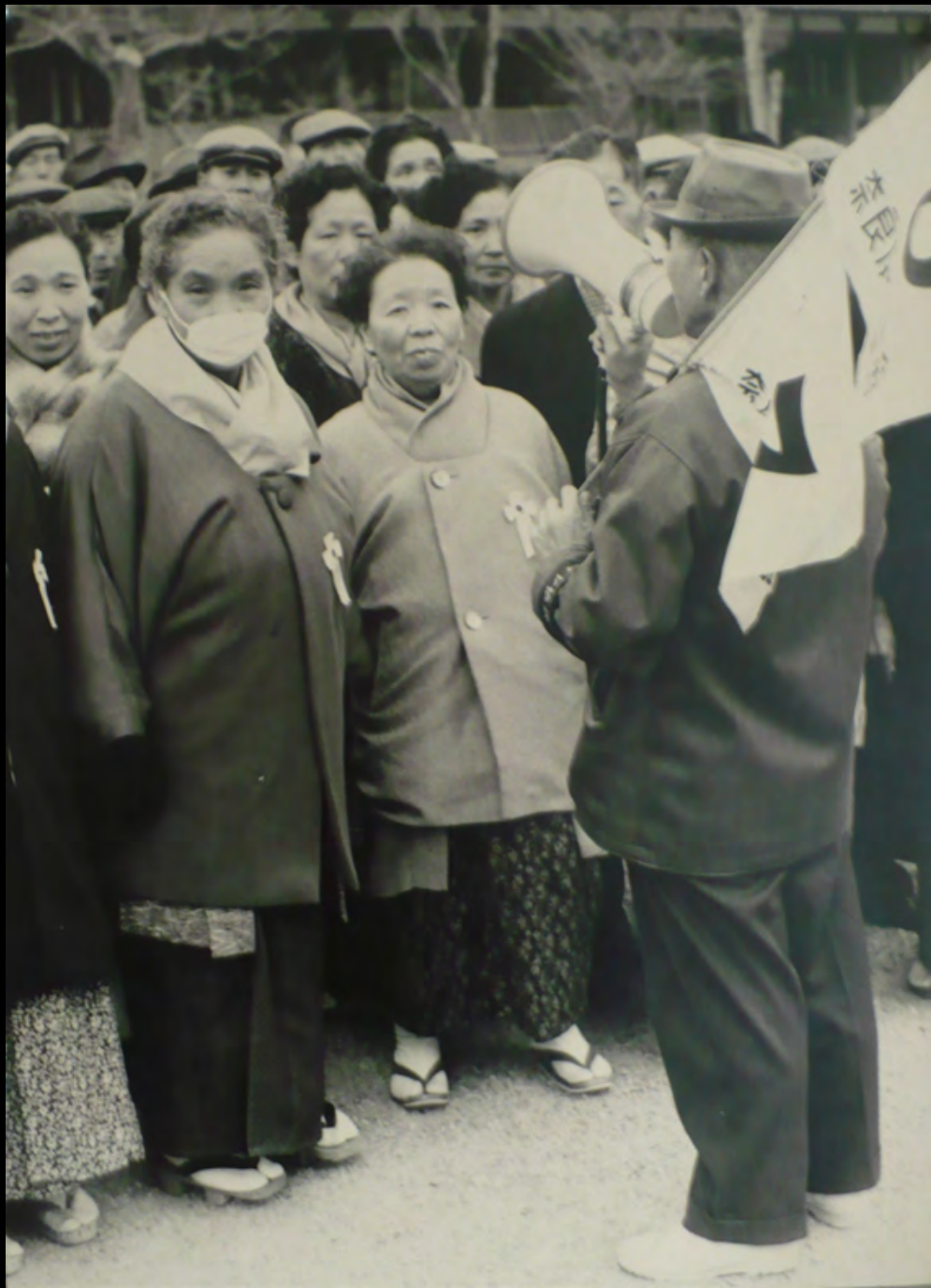
28. [Japon]. ANONYME. Manifestation Tirage original sur papier baryté, contre-collé sur carton. ca.1970. Dimensions : 38,5 x 28,7 cm. 80 €