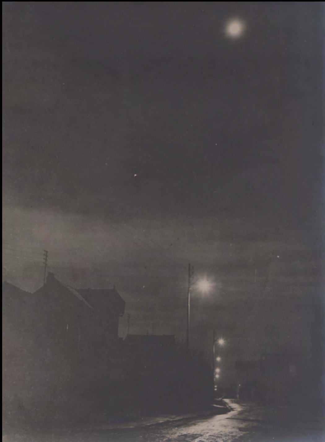
1. ANONYME La Banlieue, la nuit . Tirage argentique. ca.1930. Dimensions : 23,7 x 18 cm. Titré au dos à la mine de plomb. 300 €