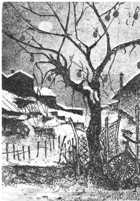
AIME CATALOGO n.218

MANFREDI ALBERTO. 97 Incisioni dal 1977 al 1984. Con uno scritto di Paolo Bellini . Reggio Emilia 1985 8°, pp. non num. 204 su carta patinata, con 97 Tav. f. testo, edizione tirata a 520 esempl. numerati. Brochure edit. illustrata con titoli al dorso e al piatto.